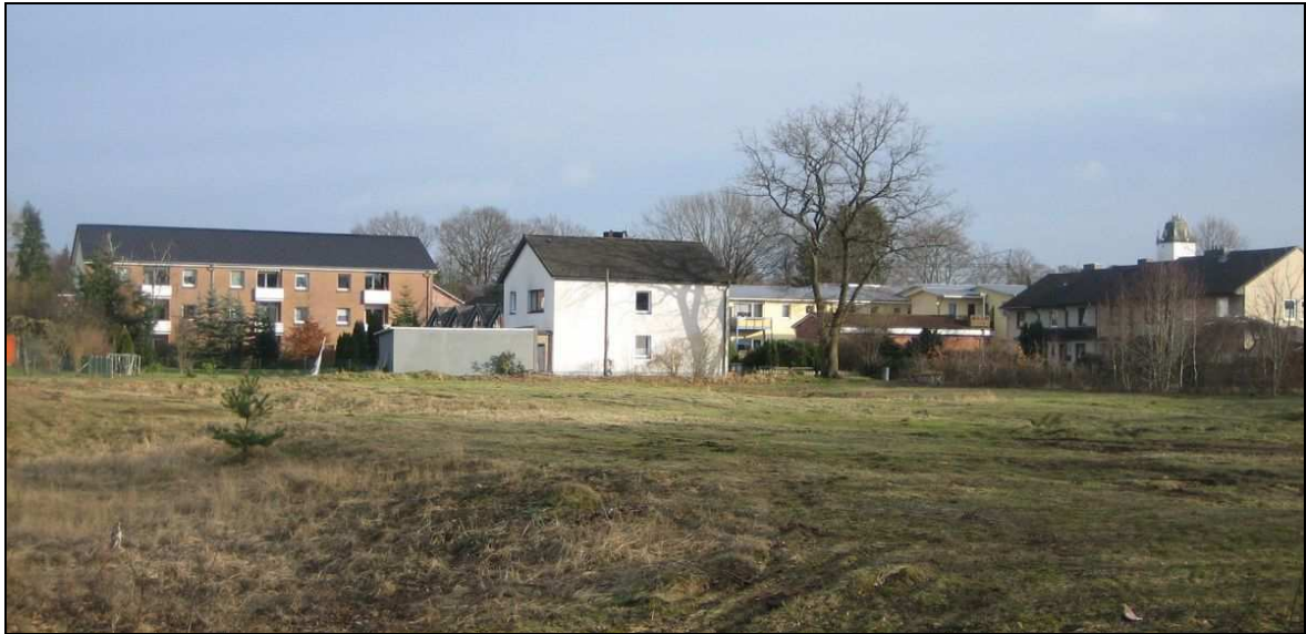
Abbildung 5: Nordöstlich angrenzende zwei- bis dreigeschossige Bebauung an der Straße "An den Eichgräben"