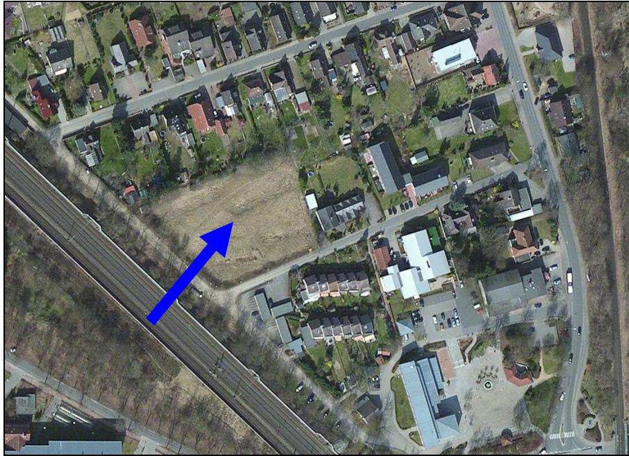
Abbildung 3: Luftbild als Übersicht zur Lage des Plangebietes