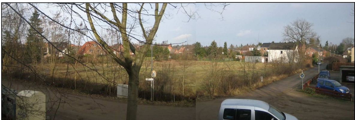
Abbildung 4: Blick vom Bahndamm auf das Plangebiet mit der angrenzenden Bebauung an der "Holstenstraße" und an der Straße "An den Eichgräben"

Auf den beiden Grundstücken standen ursprünglich vier zweigeschossige Wohnhäuser mit insgesamt 36 kleinen Wohnungen aus den 1950er Jahren, die im Jahre 2000 abgebrochen wurden. Die Lage der hier vorhandenen Gebäude ist anhand der Topographie der Fläche noch ablesbar. Die Grundstücke wurden seitdem nicht genutzt und erst kürzlich von der Gemeinde erworben, um sie wieder zugunsten einer Wohnbebauung zu entwickeln. Das Plangebiet wird im Norden, zur Wohnbebauung an der "Holstenstraße", nach Westen zur Straße "Am Bahndamm" und nach Süden zur Straße "An den Eichgräben" durch Knicks begrenzt.