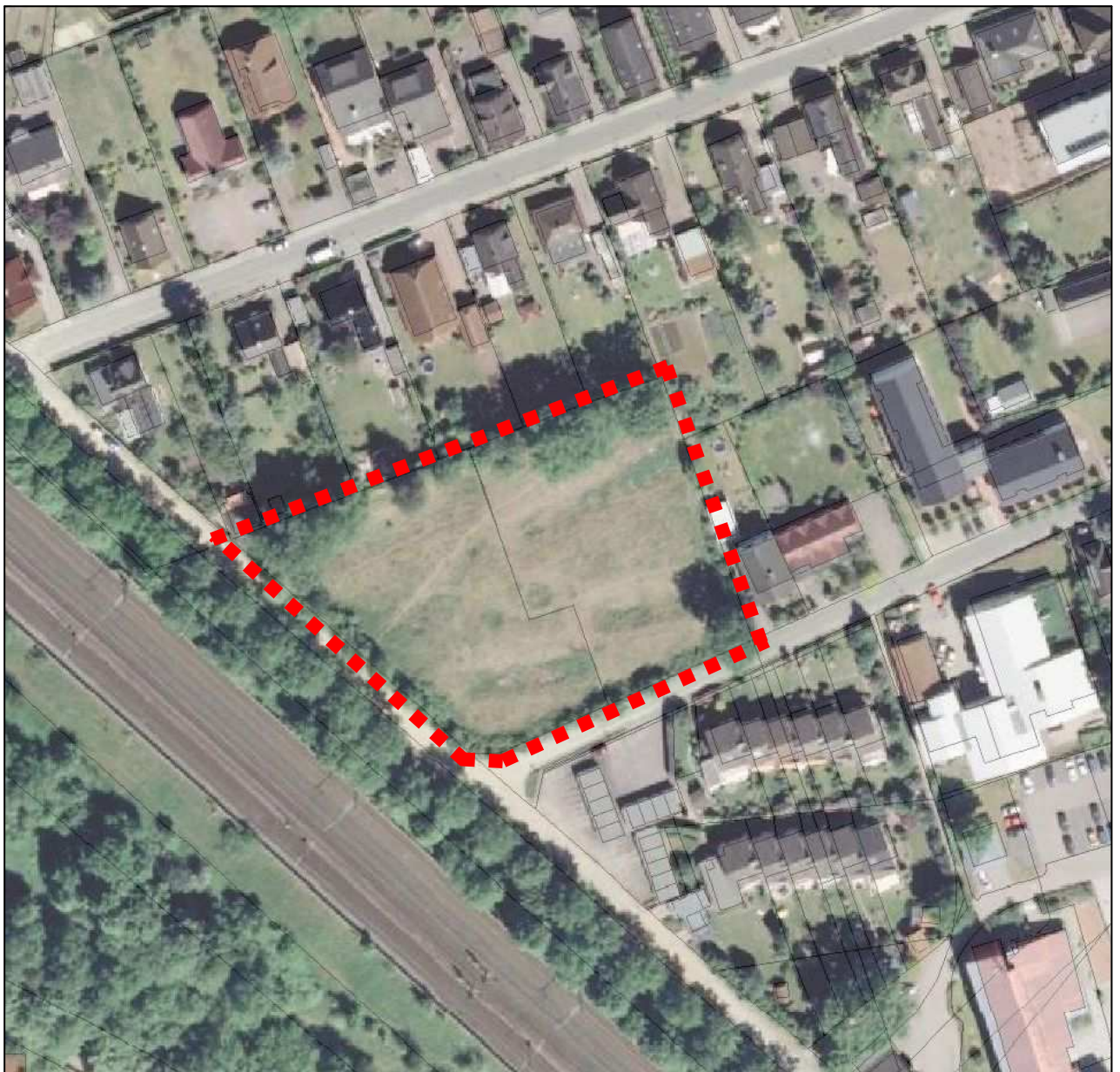
Übersichtsplan mit Plangeltungsbereich